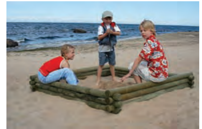
Rundholz Sandkasten, (Ø 7 cm Nadelholz, kesseldruckimprägniert). Komplett mit Holzboden und 2 Sitzbrettern. Sehr stabile und robuste Ausführung, ca. 180 x 180 cm, Höhe 27 cm. Typ Matthias Art.Nr.: 006 48006