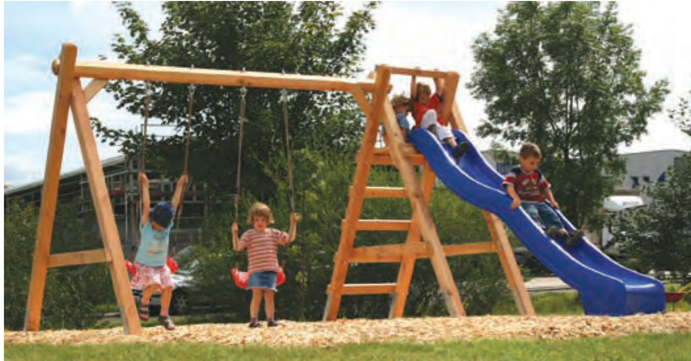
Doppelschaukel mit Rutsche Easy-Bausatz – alle Verbindungen vorgebohrt Höhe 215 cm, Aufbaubreite 365 cm. Komplett mit zwei Schaukeln, Leiter und Rutsche. Art.Nr.: 001 82051