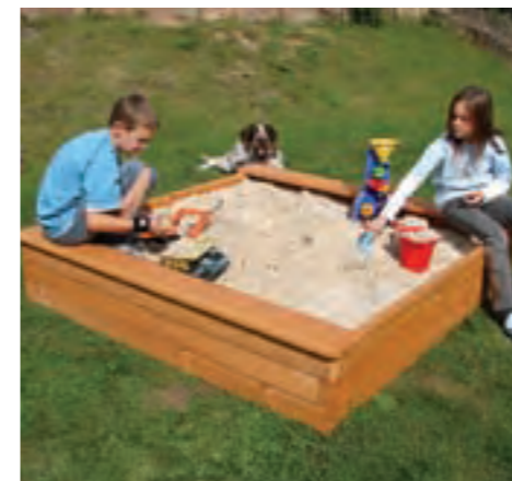
Sandkasten mit klappbarem Deckel als Sitzbänke nutzbar. Kiefer KDI 26 mm 004 48005 150 x 150 cm