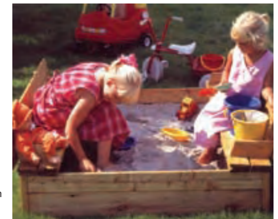
Sandkasten DouglasPlus Balken 45 x 95 mm, sehr stabil, mit 2 Sitzbrettern 001 48020 150 x 150 cm