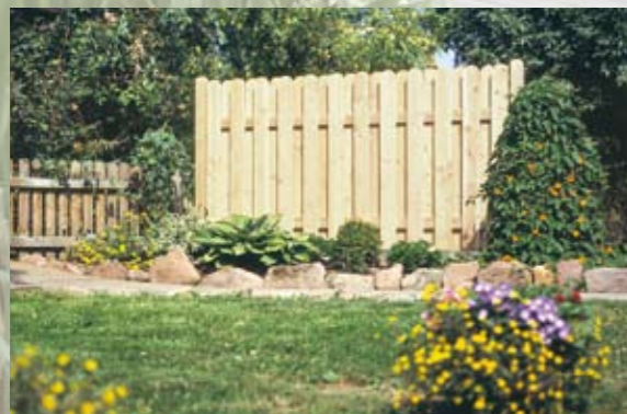
Zaunleisten 21 x 145 mm mit Rundkopf, glatt gehobelt, für den individuellen Zaunbau: