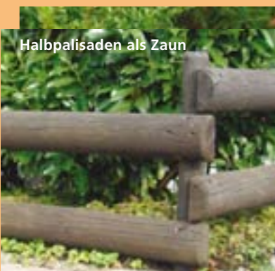
Halbpalisaden als Zaun

aus Lärche/Douglasie, Eiche/Kastanie und druckimprägnierter Fichte