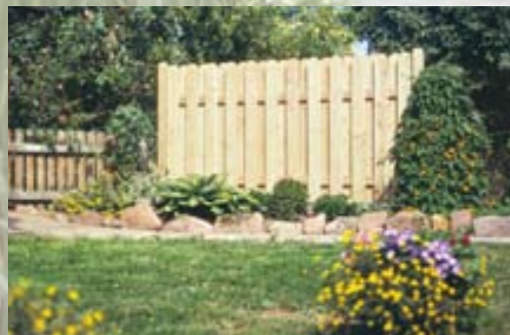
Zaunleisten 21 x 145 mm mit Rundkopf, glatt gehobelt, für den individuellen Zaunbau: