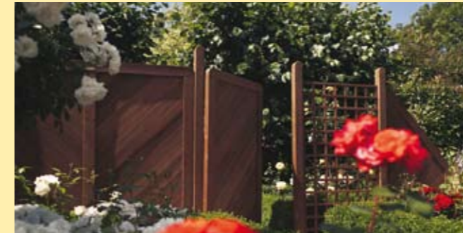
Ambiente: Massiv , kräftig und edel (S. 28)