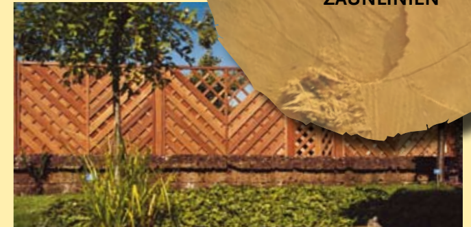
Ambiente: Elegant , stilvoll und graziös (S. 34)