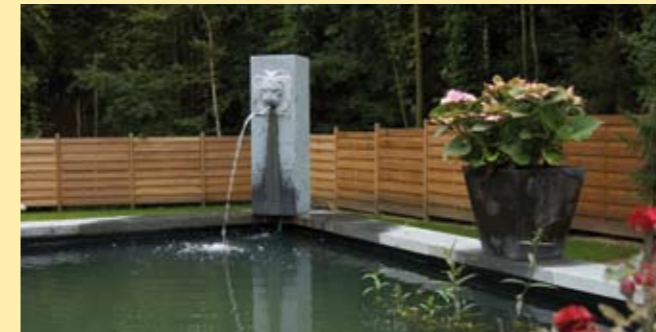
Ambiente: Charmant , fein und freundlich (S. 30)