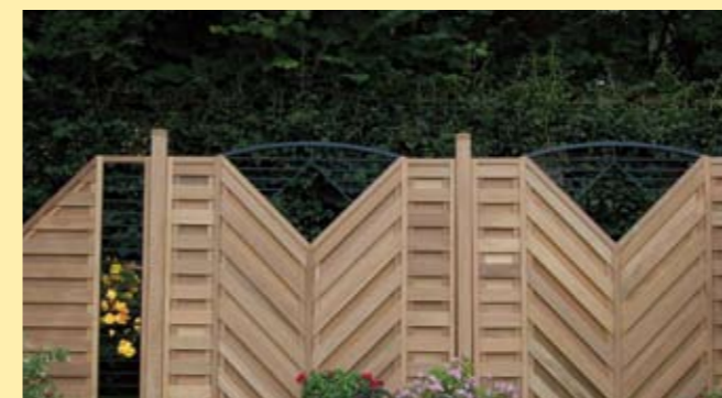
Ambiente: Select , einzigartig und beeindruckend (S. 32)