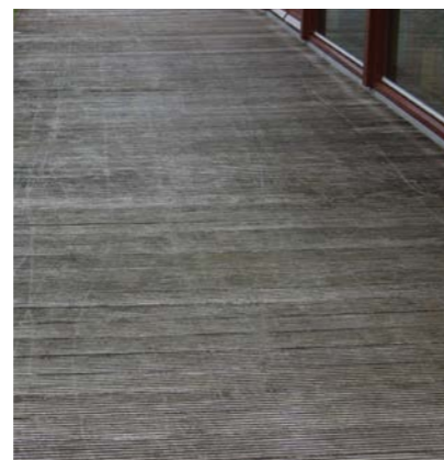
Vor der Behandlung mit Holzentgrauer