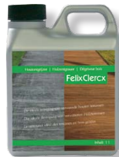
Holzentgrauer 1 L Art. 512001

Einfach aufzubringen, Geruchsarm, mit Wasser verdünnbar, effektive Reinigungs- und Entgrauungswirkung durch Oxalsäureanteil, bleicht sogar Oxidflecken auf Holz.