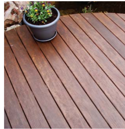
Nach der Behandlung mit Holzöl