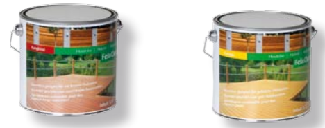
Felix Clercx Holzöl Bangkirai, 2,5 L Art. 511502